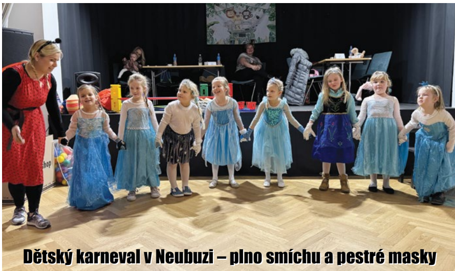
Dětský karneval v Neubuzi – plno smíchu a pestré masky

V neděli 25. ledna 2025 se KC v Neubuzi proměnilo v pohádkové království plné princezen, superhrdinů, zvířátek i kouzelných bytostí. KŠ SOVA pořádala dětský karneval, který i přes začínající chřipkové období, přilákal přes 40 dětí v doprovodu rodičů, babiček i dědečků.