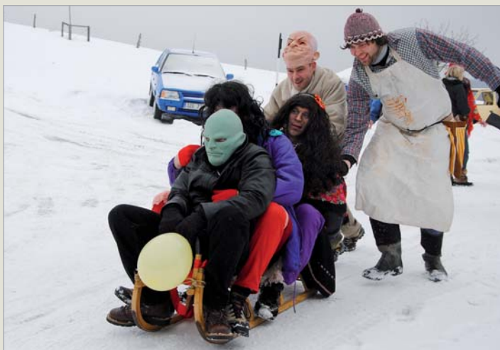
Končiny • tradiční Končiny jsou v režii hasičů