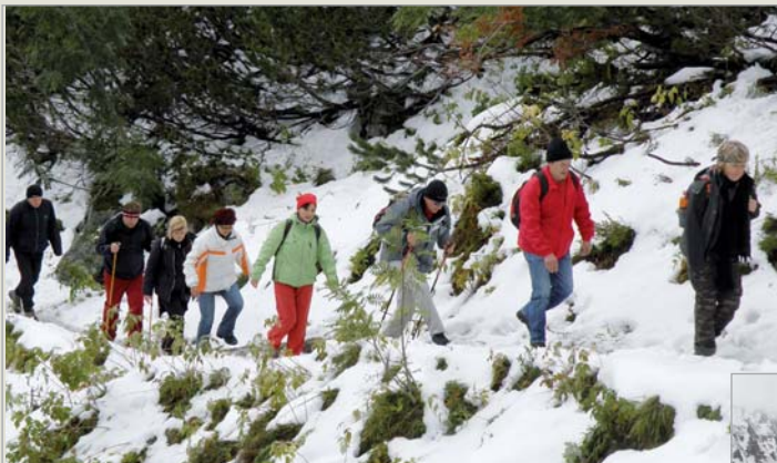
Volný čas • v Neubuži jsou zdatní turisté – zvládli drsné počasí na Roháčích, 26 km dlouhou trasu v Jeseníkách i nástrahy sklepa v Polešovicích