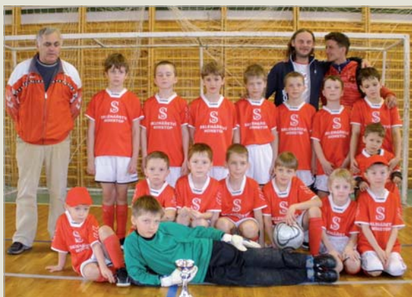
Fotbal • začínají nám konečně vyrůstat noví nebuduší fotbalisti