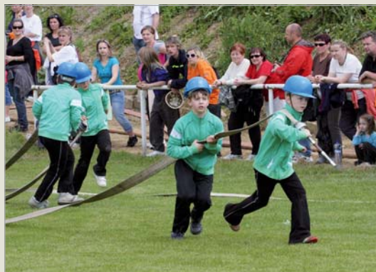
Pouť • při pouti 2010 se světila hasičská stříkačka za 105.000 Kč